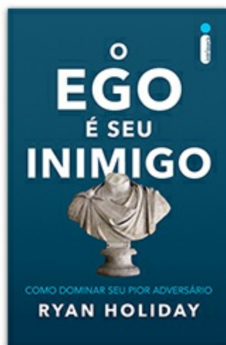
O ego é seu inimigo Ryan Holiday