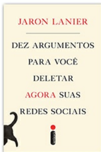
Dez argumentos para você deletar agora suas redes sociais Jaron Lanier